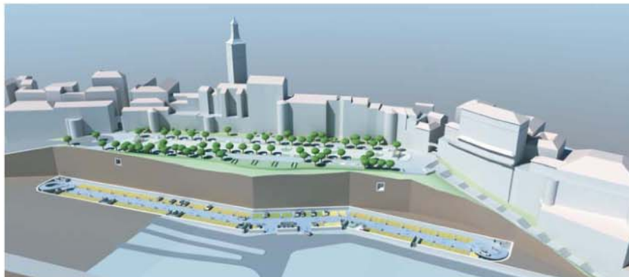
Nivel 0. Aparcamiento de rotación. 136 plazas