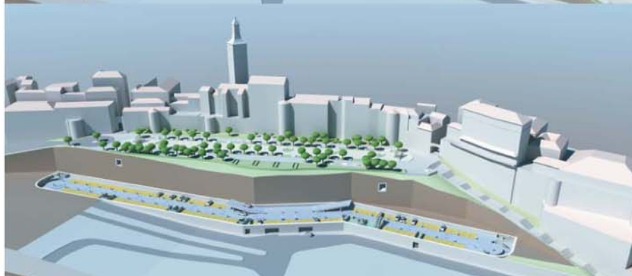
Nivel 1. Aparcamiento de rotación. 125 plazas